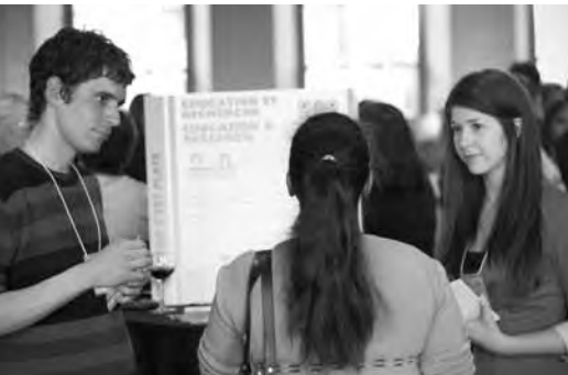
L'Apathie, c'est plate était l'un des 35 organismes présents.

BARBARA • GENERAL MANAGER, INFINITHÉÂTRE / ygraine7@videotron.ca