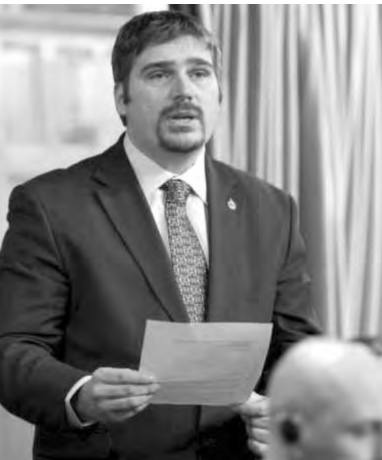
Le député néodémocrate de Repentigny, Jean-François Larose.