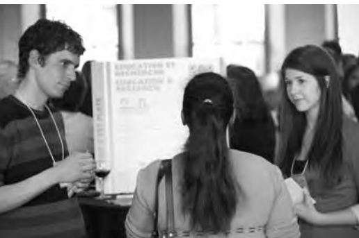
L'Apathie, c'est plate était l'un des 35 organismes présents.