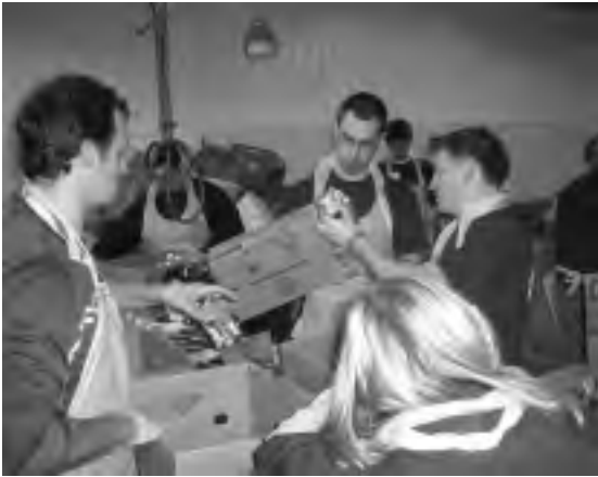
Des bénévoles de SAP heureux d'aider le Welcome Hall Mission.