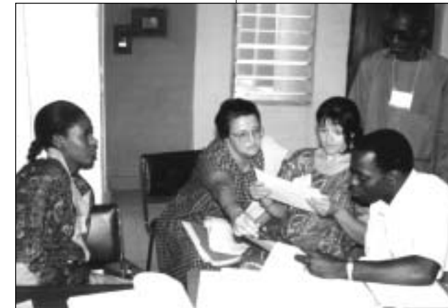
Volontaires Uniterra en action !

Formerly reserved to of seasoned specialists in international cooperation, overseas voluntary service is increasingly open to women and men interested in experiencing globalisation first-hand. Internships and postings from two weeks to two years in duration are now available, notably through Uniterra's network in South America, Africa and Southeast Asia.