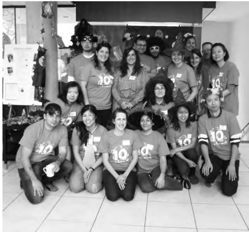
The SAP cooks and entertainers at the Ronald McDonald House Halloween event.