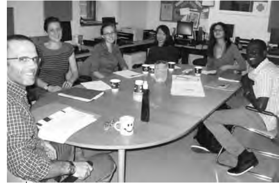
Une photo de moi en formation avec une équipe de bénévoles.

Je suis heureux d'apprendre, lors de la journée de l'Observatoire sur le bénévolat qui s'est tenue à Trois-Rivières le 7 novembre dernier, que de l'étude sur « Le bénévolat en loisir et en sport, 10 ans après », ressortait l'importance du soutien à apporter aux bénévoles et la nécessité d'être clair et précis dans nos attentes et dans les tâches que l'on souhaite leur confier. Aussi, les bénévoles eux-mêmes voient les professionnels en loisir comme des gestionnaires de bénévoles.