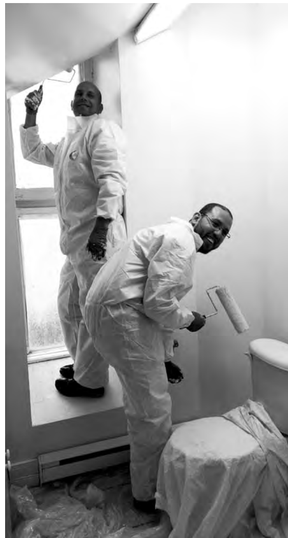
Peinture de la tête au pied à Partageons l'espoir.