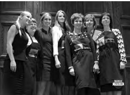
Avec les bénévoles de La Grande Tablée de Québec, au Fairmont Le Château Frontenac, le 20 octobre 2014.

PAR FANNY MARCOUILLIER-MATHIEU, stagiaire à La Tablée des Chefs