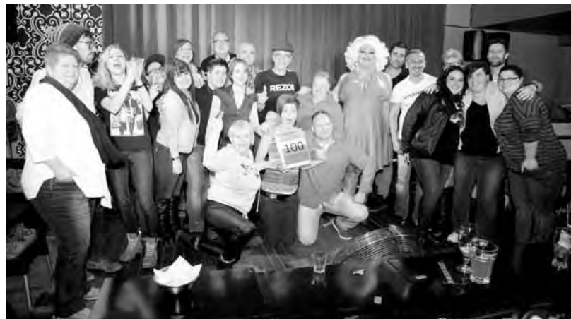
Soirée cocktail ensachage.

* RÉZO privilégie une approche globale de la santé et fournit aux hommes gais et bisexuels séronégatifs ou séropositifs des connaissances et des moyens pour développer et maintenir un plus grand contrôle sur leur santé physique, mentale, affective et sociale.