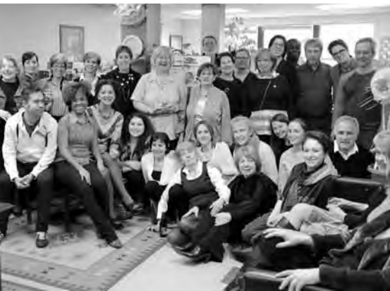
Bénévoles et employés du CABM posant pour la postérité lors du lancement de la vidéo BEN, le plus beau réseau des bénévoles!

Nous sommes tous dans le même bateau, avec des rôles différents mais avec un seul objectif : faire le plus beau voyage possible ensemble! C'est ce que j'ai appris et j'entends bien le vivre encore longtemps!