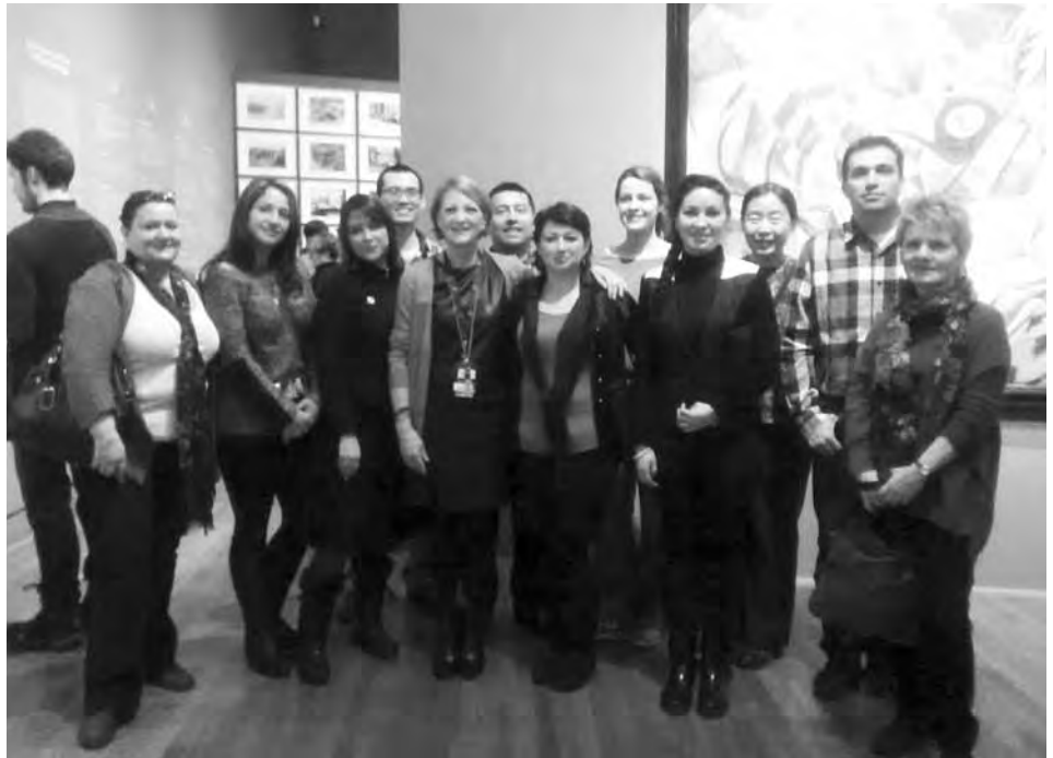
Visite au Musée avec les nouveaux arrivants.

Ainsi, au fil des semaines, ils apprennent à prendre « leur » place, à m'interrompre s'ils ne me comprennent pas dans le but de créer un nouveau comportement et ainsi exiger de se faire parler partout « en français ». Je suis heureuse de les voir développer entre eux des liens de confiance au contact des autres.