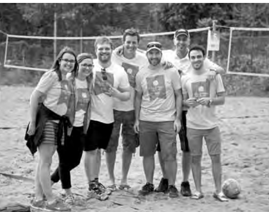
Des bénévoles lors du tournoi de volleyball BEC 2014.

Pour être au courant de nos prochains projets et événements, suivez-nous sur Facebook ( facebook.com/BEC ) ou visitez notre site web www.le-bec.org .