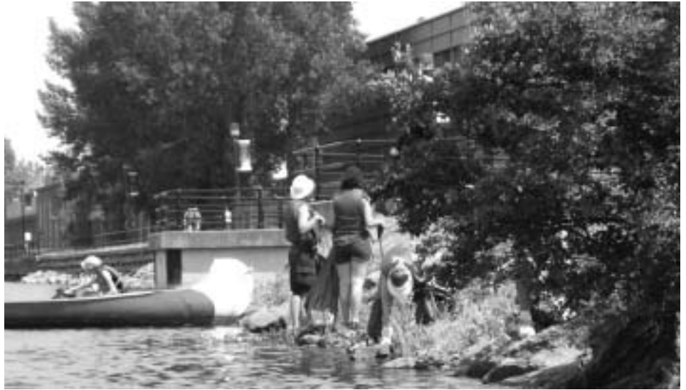
Groupe de bénévoles en pleine action lors du projet organisé par Pro-Vert Sud-Ouest « Le canal Lachine prend son envol ».

Certains organismes comme Famijeunes et Mères avec pouvoir , ont recours aux groupes pour des tâches plus manuelles. Les lieux reçoivent ainsi une cure de beauté tandis que se