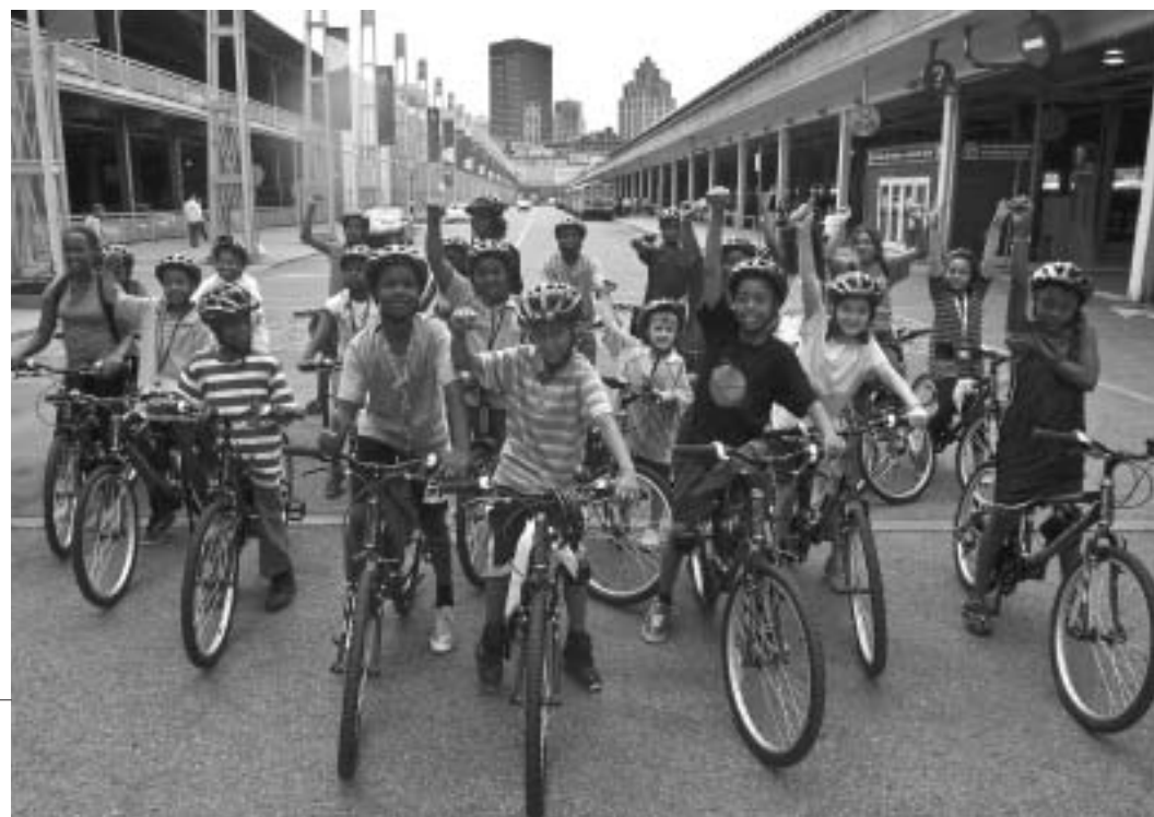
Tyndale tykes like their striking new bikes.

I can't promise new bikes for every organization that agrees to host a group of volunteers but I can offer my assistance in helping you recruit a dedicated group to best meet your organization's needs.