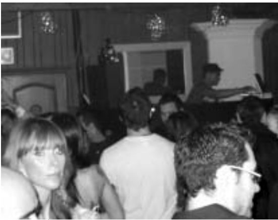
Volunteers partying at the Gotsoul event in December.