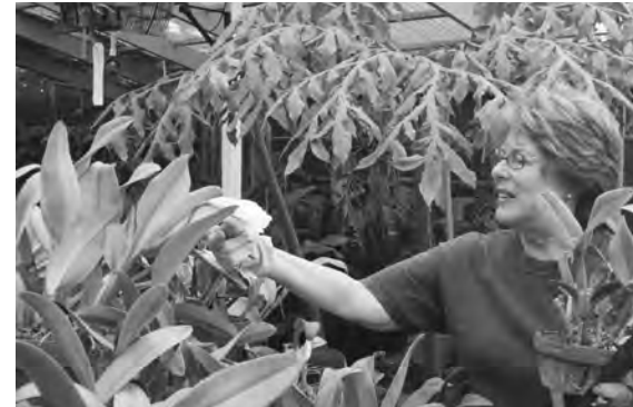
Une jardinière bénévole à l'oeuvre

There are many ways in which organizations can benefit from specific professional skills both on their boards of directors and in their operations. Executive directors are often required to be generalists, managing with limited human and financial resources. Organization development, fundraising, management and communications skills could come in very handy. Many projects require project coordinators, but often a member of the team with other day-to-day responsibilities takes on this role and becomes overextended. How many dreams remain dreams because the time and/or skills are never found to make them come true?