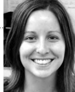
Par Dominique Arsenault, agente des relations communautaires

* Ont contribué bénévolement à ce bulletin