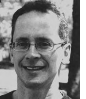
par François Lahaise, agent des communications du CABM

If your campaign is to cost you nothing, you also need to recruit volunteer graphic artists. The VBM would be pleased to help you in your search for these invaluable individuals!