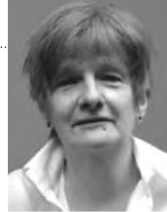
par Marjorie Northrup coordonnatrice aux Services alimentaires bénévoles

Date limite pour le dépôt des candidatures : le vendredi 27 mars 2009. Plus d'information sur : carold.ca (Bourse Alan Thomas)