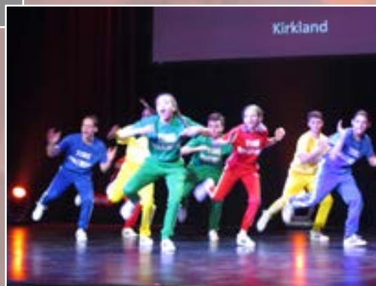
Les jeunes de la compagnie de danse Break City offrent une performance enthousiaste aux invités du Gala!