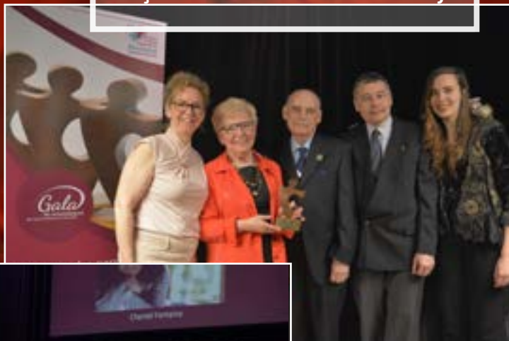
La Famille Choquette de l'organisme Les petits frères reçoit le Prix du bénévolat collectif!